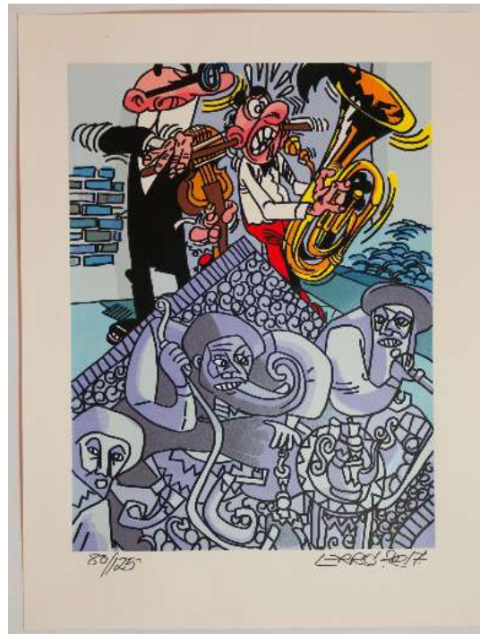
Artiste : Erró Titre : Talibans Dim. : 70 x 100 cm Sérigraphie