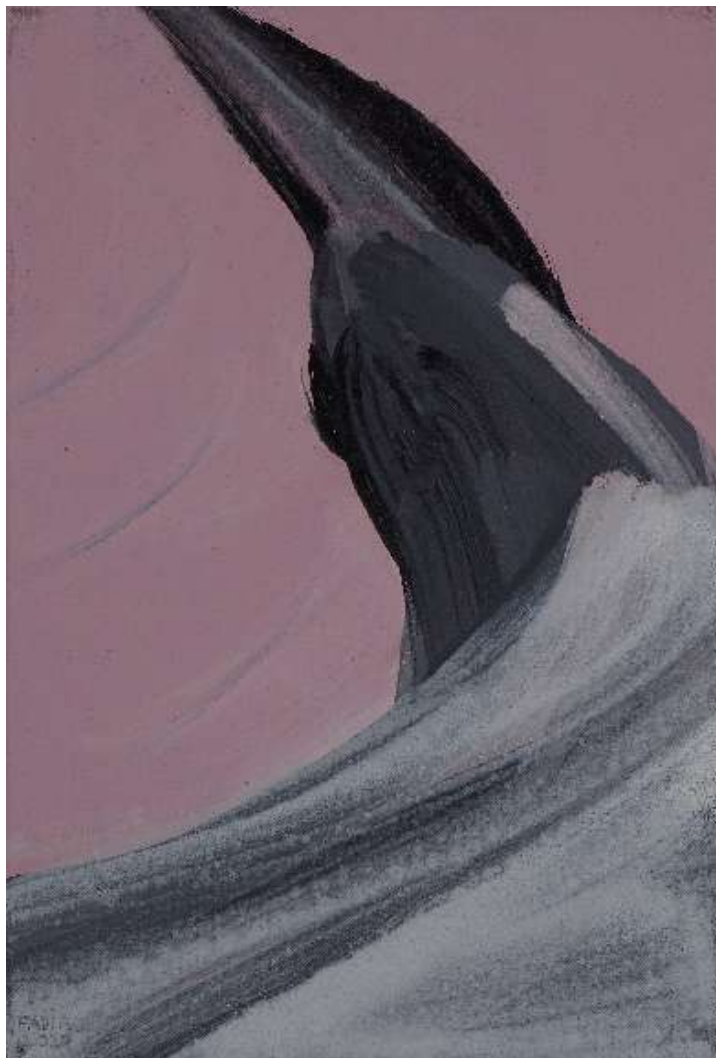
La symphonie des oiseaux 2020

Dim. 33 x 22 cm Pigments et medium acrylique sur toile