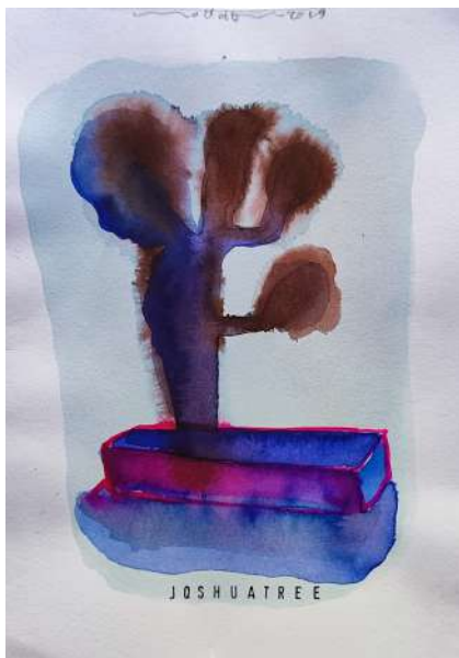
Joshuatree Encre et acrylique sur papier Dim. 19 x 15 cm Prix : 400€ l'œuvre