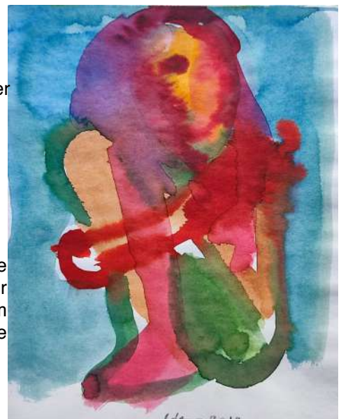
Sans titre Encre et acrylique sur papier Dim. 19 x 15 cm Prix : 400€ l'œuvre