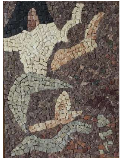
Des ails et des espaces

Houda Moussa développe une pratique de mosaïque à travers la recherche picturale basée sur le traitement de photos de son archives à Bosra en Syrie. Un alphabet de formes est utilisé méticuleusement pour construire par l'assemblage une architecture imaginaire. Une série de 15 tableaux de format unique 30x42cm est le résultat d'un long travail d'observation sur la région du sud de la Syrie où le paysage est typique, et se distingue surtout par la pierre noir basaltique (l'élément principal de l'architecture). Les couleurs dominantes sont le noir couleur de la pierre et des ruines, le rouge couleur de la terre, et l'ocre jaune couleur des champs du blé!