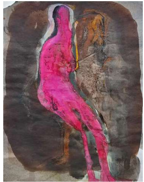
Sans titre 2 Encre et acrylique sur papier Dim. 19 x 15 cm Prix : 400€ l'œuvre 1150€ la série