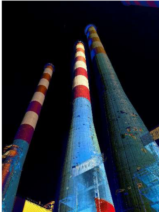
Sans titre, 2022 épreuve d'artiste Photo sur papier archival Dim. 42 x 60 cm