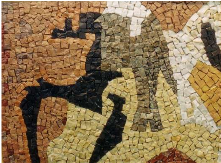
L'ermite devant le temple