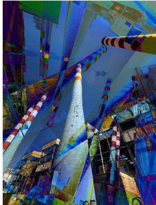
Prix : 350 € une œuvre 650 € les 2 œuvres

Lauréat de la bourse de la villa Médicis. Antoine Poupel est préoccupé par l'étymologie même du terme photographie, il est bien question de peindre, de dessiner. Ainsi la notion d'auteur demeure centrale dans son travail. « Si j'ai choisi le médium photographique, c'est pour déconstruire son caractère mécanique, réintroduire la part de l'artiste qui utilise la lumière comme une matière picturale ». Son travail artistique avant-gardiste, questionnant les limites picturales et chimiques de la photographie, l'a fait connaître dans le monde entier.